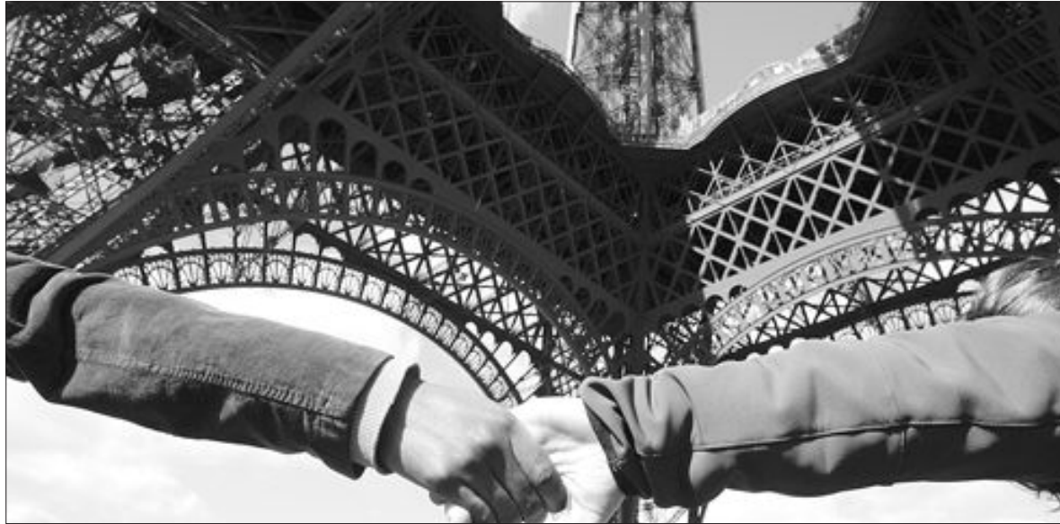
佛 노동법 철폐할 때까지... '에펠탑 결의'로 손을 맞잡고 있다. 4일 프랑스 전역에서 열리는 최초고용계약 반대 항의 시위를 하루 앞둔 3일 학생들이 에펠탑 아래서 승리를 기원하며 서로 손을 맞잡고 있다. /연합뉴스

태국의 반(反)탁신 세력은 3일 정치위기 타개를 위해 '국가화해위원회' 구성하겠다는 탁신 치나왓 총리의 제안을 믿을 수 없다면서 거부사를 분명히 했다. 반탁신 시위를 이끌고 있는 언론인 손터 립퐁쿤은 이날 로이터 통신에 "탁신 총리는 과거와 여전히 똑같은 사람이다. 그는 매우 이기적이다"며 그는 숫자 조작을 통해 권력 유지를 위한 적당한 구실을 찾으려 한다고 주장했다. 야당인 민주당 대변인은 "우리는 (탁신) 총리를 더 이상 신뢰하지 않는다"며 "따라서 그의 제안에 아무런 관심이 없다"고 일축했다. /연합뉴스