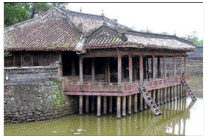
전쟁의 아픔을 고스란히 간직한 '후에 성'과 화려함을 추구했던 투득 황제가 궁녀들과 함께 놀았던 썩기엔 정자.

으려 했다. 한달동안의 폭격으로 인해 없어진 내성의 흔적을 찾아 복원 중이다. 9개의 신선한 대포와 황실의 중요한 의례에 사용된 태화전, 9명 황제의 위패가 모셔진 세조묘등이 있다. 후에 성 맞은 편에는 베트남 최고 높이(37m)의 '왕의기사'라 불리는 깃대에 베트남 국기가 새롭게 변화하고 있는 모습을 상징하는 듯 힘차게 펄럭이고 있다.