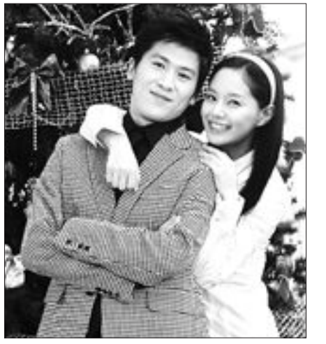
생 태경을 과외선생님으로 만나 집안의 반대를 무릅쓰고 결혼을 하면서 겪게 되는 해프닝을 그린다.