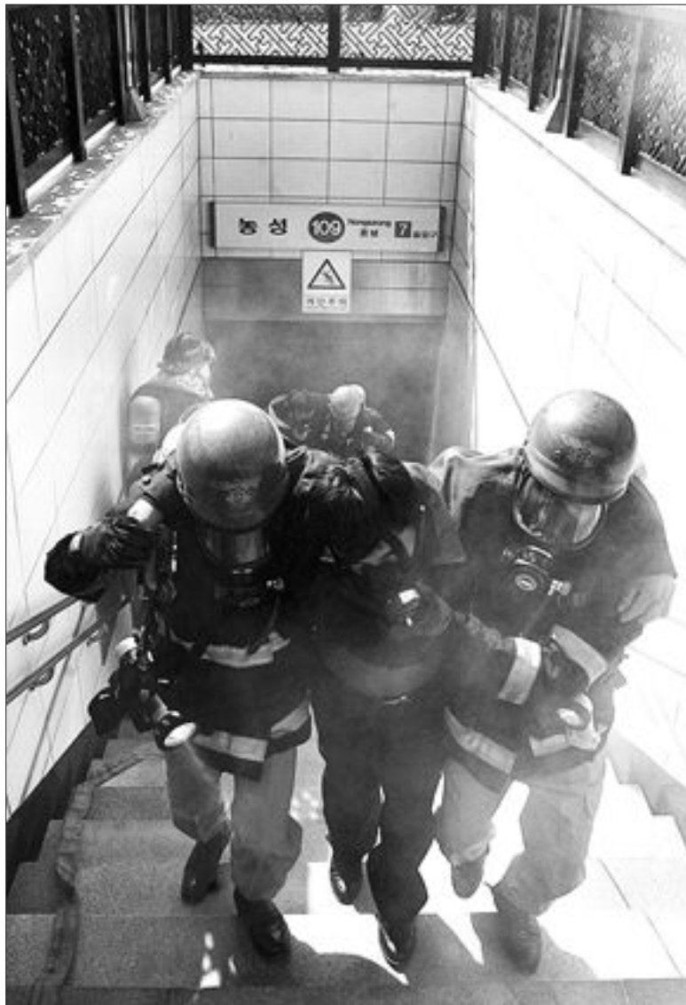
지하철 화재대비 훈련

보자를 지지·추천하거나 반대하는 내용이 포함된 게시물을 게시할 수 없다고 명시하고 있다. 개인적인 의견을 적은 글을 떠나르는 행위뿐만 아니라 언론사에 보도된 기사를 떠나르는 행위도 선거법에 위반된다.