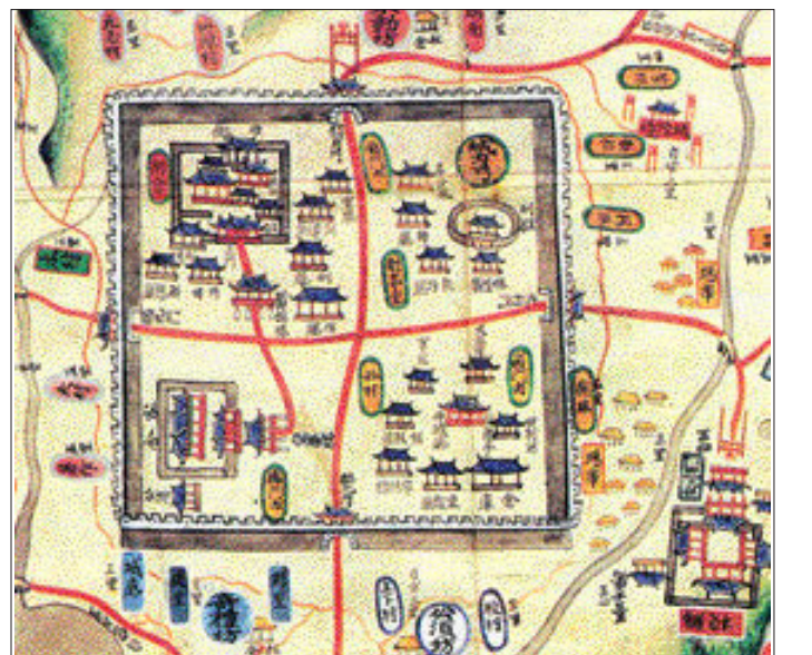
1872년 고지도에 그려진 광주읍성.

대부분의 읍성을 모양은 동그랗다. 동그런 모양을 기초로 땅의 생김새에 따라 길쭉하기도 하고 삼각 꼴을 이루기도 한다. 그런데 그런 읍성들 중 격자형 구조를 가진 네모난 읍성이 있어 눈에 띈다. 바로 남원과 광주의 읍성들이다. 남원은 신라 5소경 중 하나로 당나라의 유인계가 읍내에 정전법(井田法)을 써서 9개 구역으로 나누었다고 전해 오는데, 그 위에 읍성을 조성하였기 때문에 네모반듯한 격자형 구조를 이룰 수 있었다고 한다. 광주의 경우도 이와 비슷하다. 광주는 통일신라