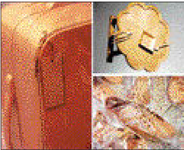
김일근 작 'GO 종이 가변설치'

종이를 주제로 작업하고 있는 미술가들이 'Cutting Mat'이란 그룹을 결성, 20일까지 지산갤러리에서 '종이야 노을자~' 전시회를 연다.