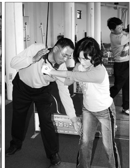
▲견고한 하체를 만들기 위해서는 다리 안쪽근육에 힘을 줘야 한다.