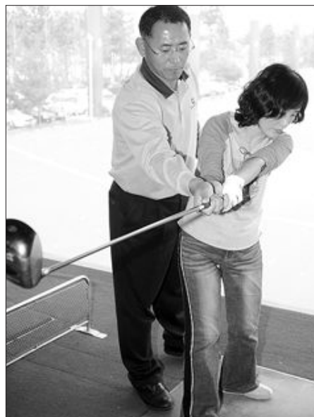
▲테이크백에서 몸통과 팔 간격이 너무 벌어진 잘못된 동작(왼쪽)을 교정하기 위해 테이크백 궤도에 클럽을 대고 몸통과 팔 간격을 좁히는 교정을 하고 있다(가운데·오른쪽).