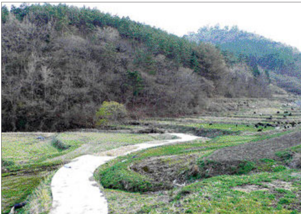
영암에는 월출산 구정봉의 14대 천자지(天子地) 외에 군신취연형, 군신봉조형, 군왕지지 등 명혈길지(名穴吉地)들이 많다. 계좌정향(癸坐丁向)의 길지인 연주안(連珠案).