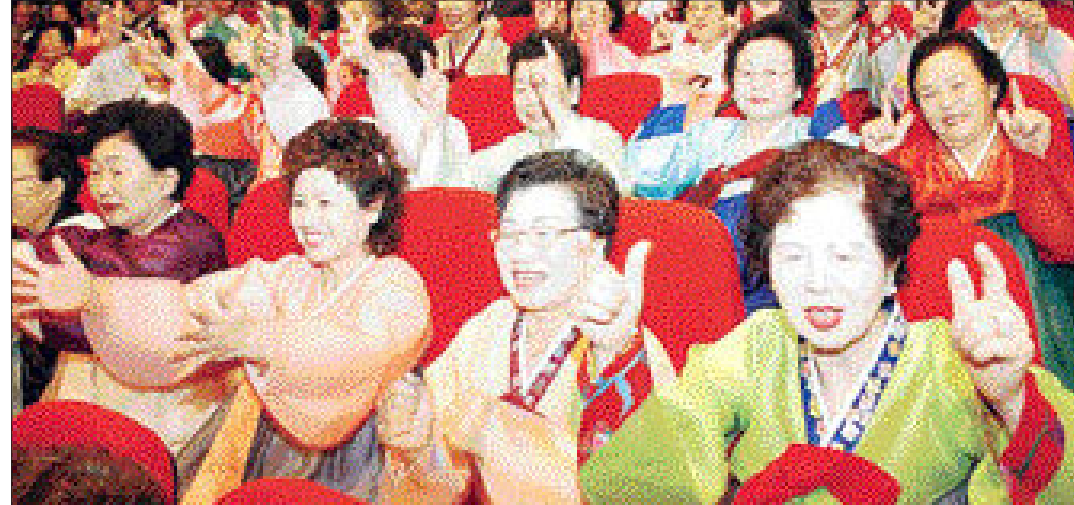
'100세 세상'을 맞이 위해서는 걷기 등 적당한 운동과 규칙적인 식사가 중요하다. 사진은 광주시 한 노인복지관에서 레크리에이션을 즐기는 노인들.

우울증은 유전, 심리적 및 생물학적 요인의 다양한 원인으로 유발될 수 있다. 노인 우울증은 신체질환이나 복용하는 약물로 인해 이차적으로 나타날 수 있으므로 이에 대한 평가가 중요하다. 일반적으로 우울증의 기본적인 증상은 기분이 우울하고, 흥미나 즐거움이 사라지는 것. 또한 피로감, 무기력, 절망감, 자살충동 등과 함께 불면증, 식욕저하, 성욕감퇴 등의 증상을 보인다. 종종 우울증으로 인해 기억력이 심하게 떨어져서 치매증상을 보일 수도 있다. 보통 우울증을 자신의 의지로 이겨야 한다고 생각하기 쉬운데, 자신의 의지만으로는 우울증에서 벗어날 수 없다. 적절한 상담이나 치료를 통해서만 우울증을 극복할 수 있다.