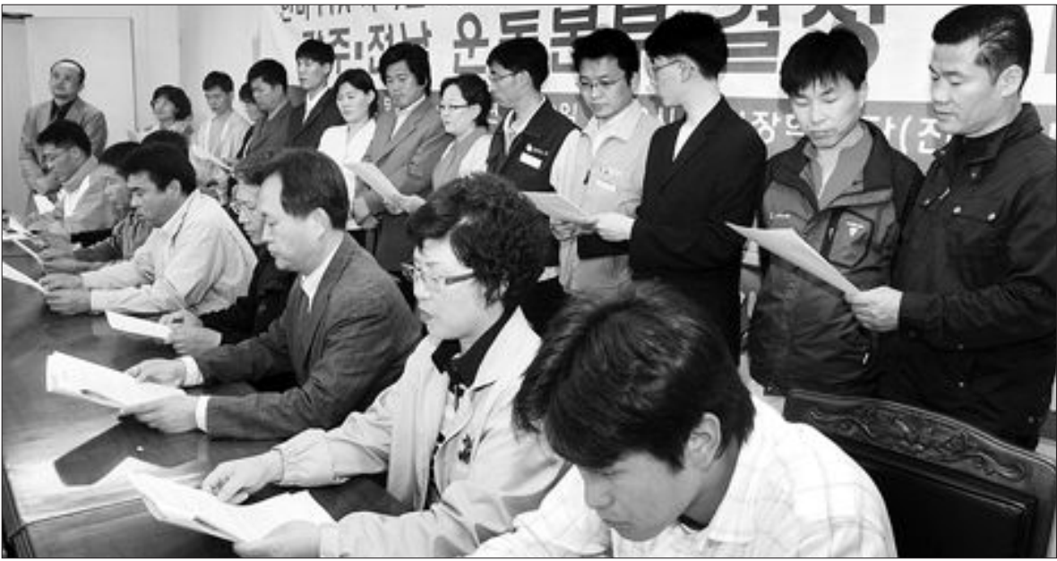
"한·미 FTA 안된다" 2일 오후 광주시 동구 금남로 전일빌딩 5층 관현장학생관에서 열린 '한미 FTA 저지를 위한 광주·전남 운동본부 발족식'.

5·31 지방선거에 처음으로 투표권을 행사하는 광주의 19세 유권자들이 청소년을 위한 정책과제를 마련, 후보자 공약에 포함시킬 것을 요구키로 했다. 광주YMCA 산하 '청소년 친구들' 소속 150여명의 회원들은 오는 13일 광주시 동구 금남로 '민주의 광' 앞에서 청소년을 위한 정책과제 발표회를 갖는다. 또 20일 열리는 '5·18 청소년 문화제-Red Festa'에서도 청소년들이 후보자들에게 바라는 정책과제를 알리고 채택을 촉구한다는 방침이다.