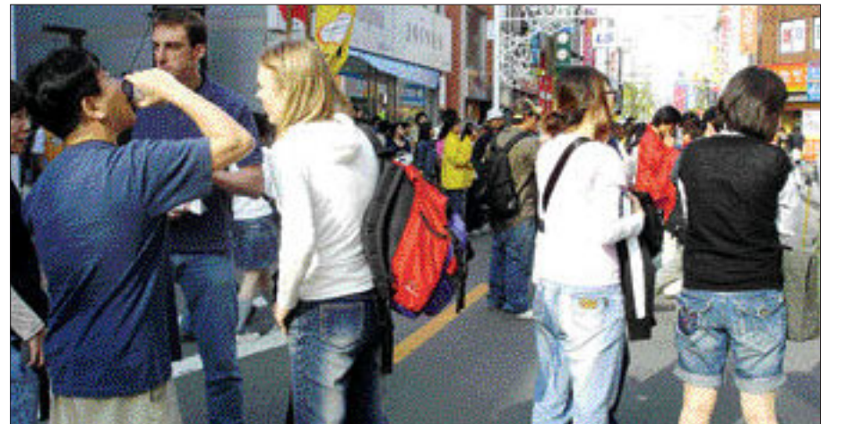
전주 고사동 영화의 거리에는 '제7회 전주국제영화제'를 즐기위해 전국 각지에서 몰려든 관객들로 붐볐다.