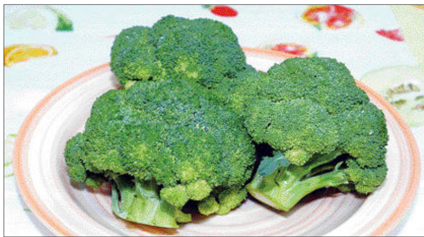
브로콜리에 함유된 설포라판은 위염 원인균인 헬리코박터 파일로리균을 박멸하는 효과도 우수하다.

들어 있는 것으로 분석돼 새싹으로 섭취하는 것이 좋다. 브로콜리를 매주 두 번 이상 먹는 사람은 매달 채소를 한 번 이하 섭취하는 사람에 비해 백내장 발생 위험을 20% 이상 낮출 수 있는 것으로 보고된 사례도 있다. /윤영기자 zenfoot@kwangju.co.kr