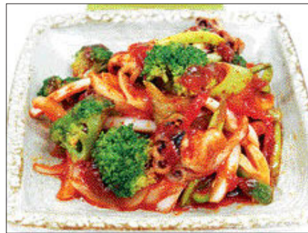
브로콜리 주꾸미 초무침