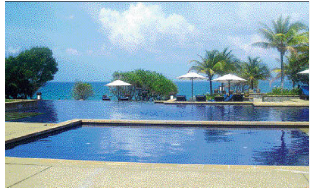
최고의 휴양리조트로 꼽히는 탄중자라 리조트는 바다와 잇닿은 수영장 등 각종 편의시설을 갖추고 있다.