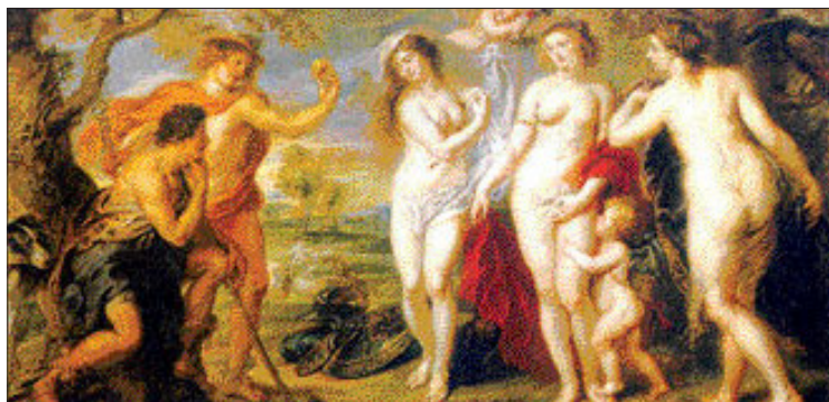
페테르 파울 루벤스 '파리스의 심판'

이 때문에 페테르 파울 루벤스가 두 번에 걸쳐 그린 '파리스의 심판'에선 유독 아름다운 아프로디테를 만날 수 있다.