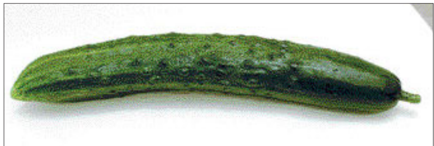
오이의 성분 가운데 하나인 칼륨은 몸 속의 노폐물을 신속하게 배출하는데 탁월한 효능이 있다.

물 안에 쌓인 노폐물이 중금속이 함께 배출돼 피를 맑게 하고 피부를 투명하게 유지해준다는 것. 오이는 숙취를 해소하는 데 도움을 주는 아스코르빈산 함량이 높아 몸 안에 있는 알코올 분해를 쉽게 하고 분해된 알코올 성분은 신속히 배출하는 작용을 한다. 오이에 술을 섞어 마실 경우 덜 취하거나, 술을 마신 뒤 숙취에 시달릴 때 오이즙을 마시면 증상이 완화되는 것은 이 때문이다. 오이 꼭지 부위에서 쓴 맛이 나는 것은 쿠커비타신(cucurbitacin)이라는 성분 때문이다. 쿠커비타신은 생육조건이 좋지 않을 경우 생성된다고 알려져 있기 때문에 꼭지 부분의 색깔이 너무 짙은 오이를 고르는 것은 피해야 한다. 또 머리 부분이 비교적 큰 반면 끝이 가늘고 흰 것은 구입하지 않아야 한다. 자라는 과정에서 해충에 대한 저항력이 약해 농약을 많이 사용했다는 방증이기 때문이다.