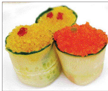
오이 날치알 초밥