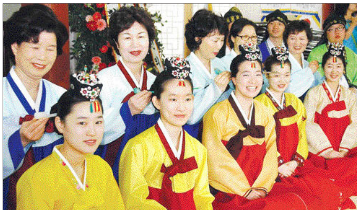
“우리도 이제 어른이예요” 15일 광주 학교에서 열린 ‘제34회 성년의 날’ 행사. 학생들이 한복을 입고 전통 관례(冠禮) 의식을 하고 있다.