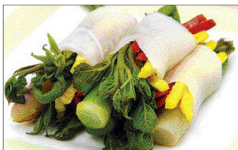
두릅 무 말이쌈