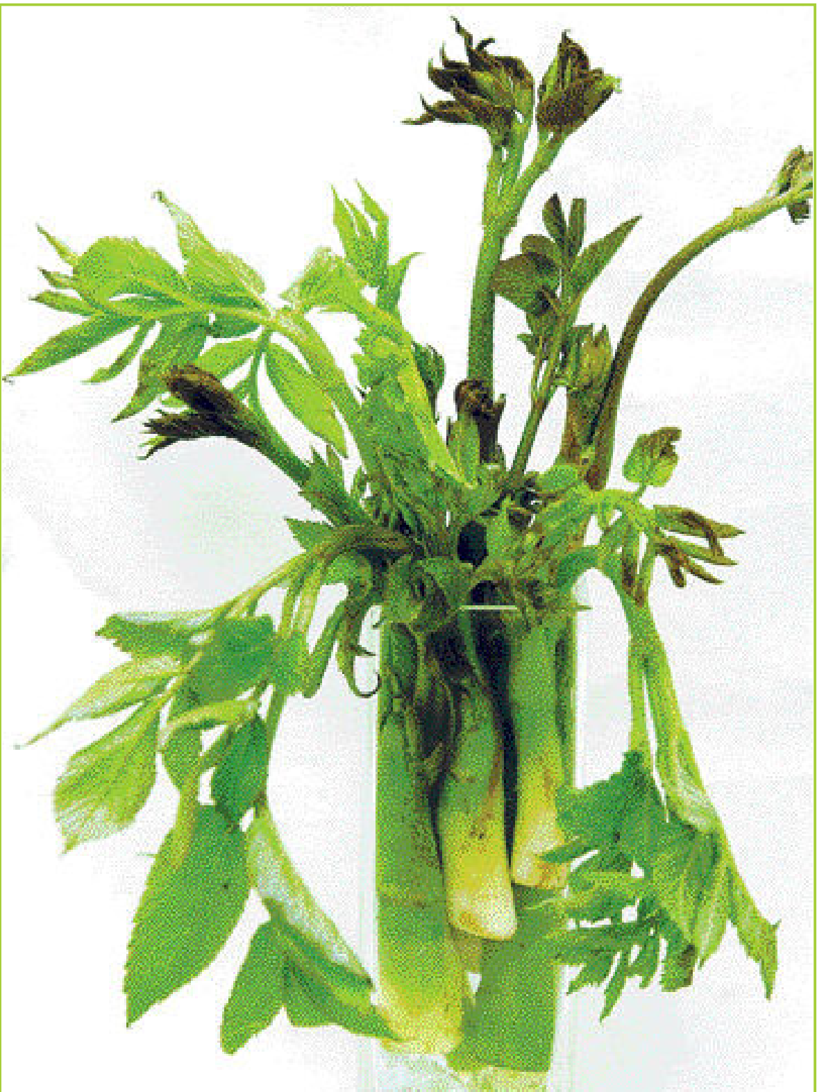
두릅은 신체에 활력을 공급해주고 피로를 풀어주는 효능을 지니고 있어 불철 권장식으로 꼽힌다.

이에 따라 당뇨병의 효과적인 관리를 위해선 혈당의 조절과 혈중지질의 관리가 동시에 필요한데, 두릅은 이 두 마리 토끼를 효과적으로 잡아주는