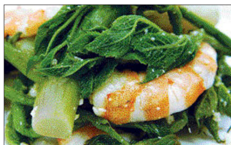
두릅 잣소스 샐러드