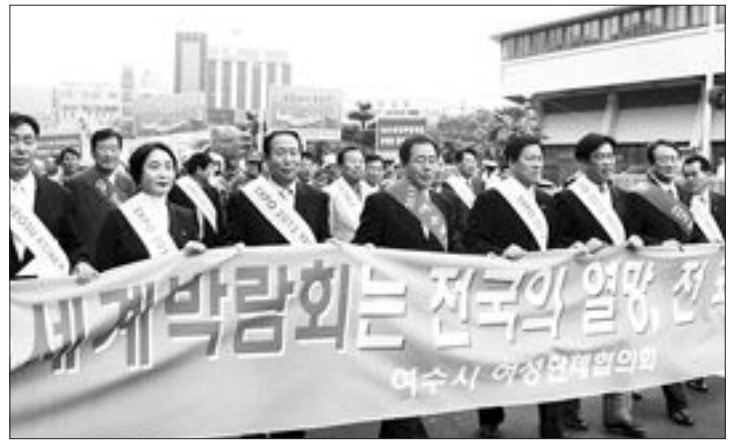
2012 세계박람회 여수 유치 성공 다짐대회가 22일 오후 여수시 학동 거북골에서 열렸다. 행사 참석자들이 박람회 유치 성공을 기원하며 가두 캠페인을 벌이고 있다.

전남도는 유치신청서 제출에 맞춰 전국 각 지역 축제 및 행사에 참석해 박람회 홍보에 나설 홍보 자원봉사단 구성과 함께 전국 시도 공무원 교육원 홍보 동영상 상영, 고속버스 측면 부착광고 등으로 유치 붐을 조성할 계획이다. 또 인천공항 및 정부 청사 옥외전광판 홍보 광고, BIE회원국에 편지보내기 등 다각적인 홍보 활동을 전개한다. 여수시도 이날 오후 여수시유치위원회 주관 세계박람회 유치 성공 다짐대회를 갖는 것을 시작으로 지역 유치 역량 결집에 나섰다.