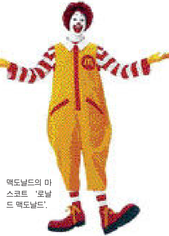
맥도날드의 마스코트 '로날드 맥도날드'.