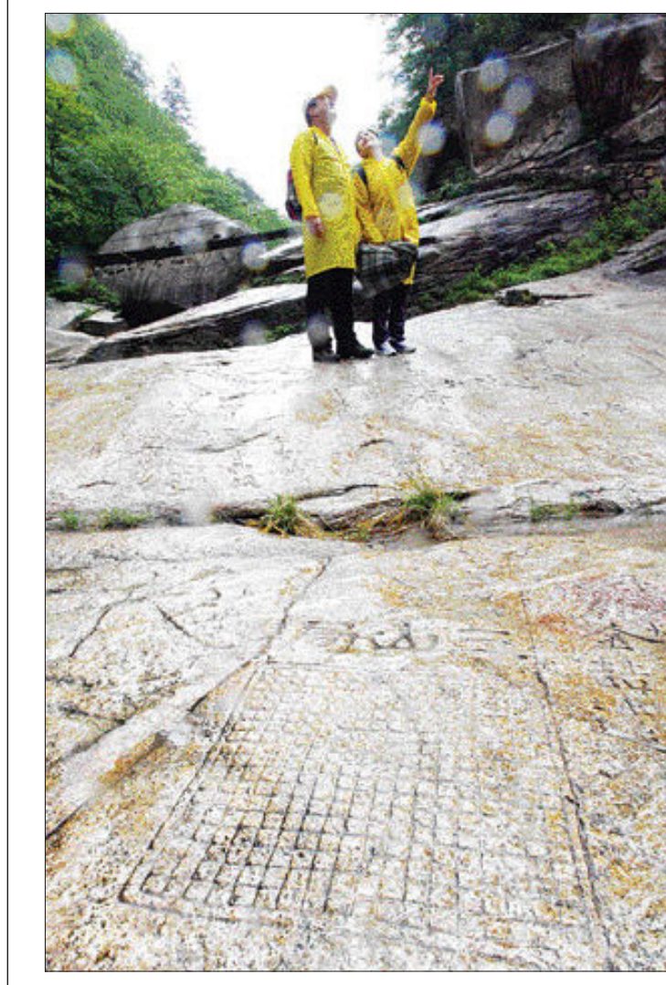
세 산의 신선이 바둑을 즐겼다는 전설이 전해지는 내금강산 만폭동 초입 계곡 바위에 새겨진 삼산국(三山局) 바둑판. 지난달 27일 내금강 관광을 위한 남북한 공동 답사가 실시됨에 따라 이 바둑판이 남쪽에 공개됐다.