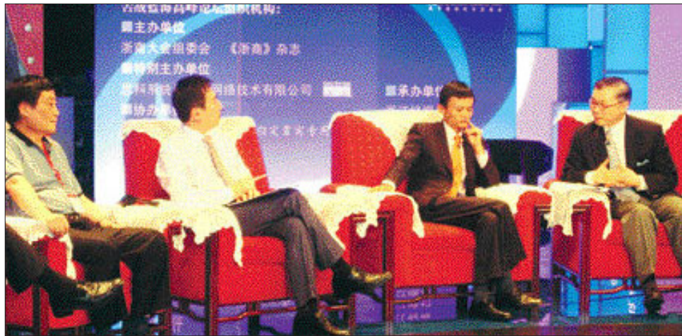
김위찬 교수가 지난 3일 중국 저장성 항저우에서 ‘저장상인대회’의 일환으로 열린 ‘블루오션 전략 포럼’에 참석하고 있다.

“중국은 아직 대답할 것보다 질문할 것이 더 많은 나라입니다” 지난해 한국에서 선풍적인 인기를 끌면서 경제 및 사회전반의 화두가 됐던 ‘블루오션 전략’의 저자 김위찬 프랑스 인시아드 경영대학원 교수는 중국에 대해 이렇게 말했다.