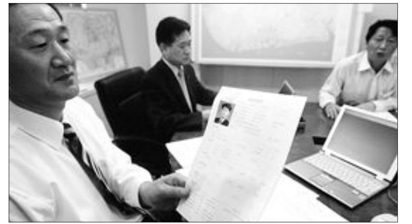
나이지리아에서 대우건설 등 한국 근로자 5명이 피랍된 가운데 7일 오후 대우건설 관계자들이 본사에 마련된 상황실에서 긴급 대책회의를 갖고 있다.

무장 단체는 로켓포 등의 화력을 갖추고 보트를 타고 구조물에 접근해 공격했고 당시 나이지리아 해군 13명이 경비를 서고 있었지만 화력열세로 공격 저지에 실패한 것으로 알려졌다.