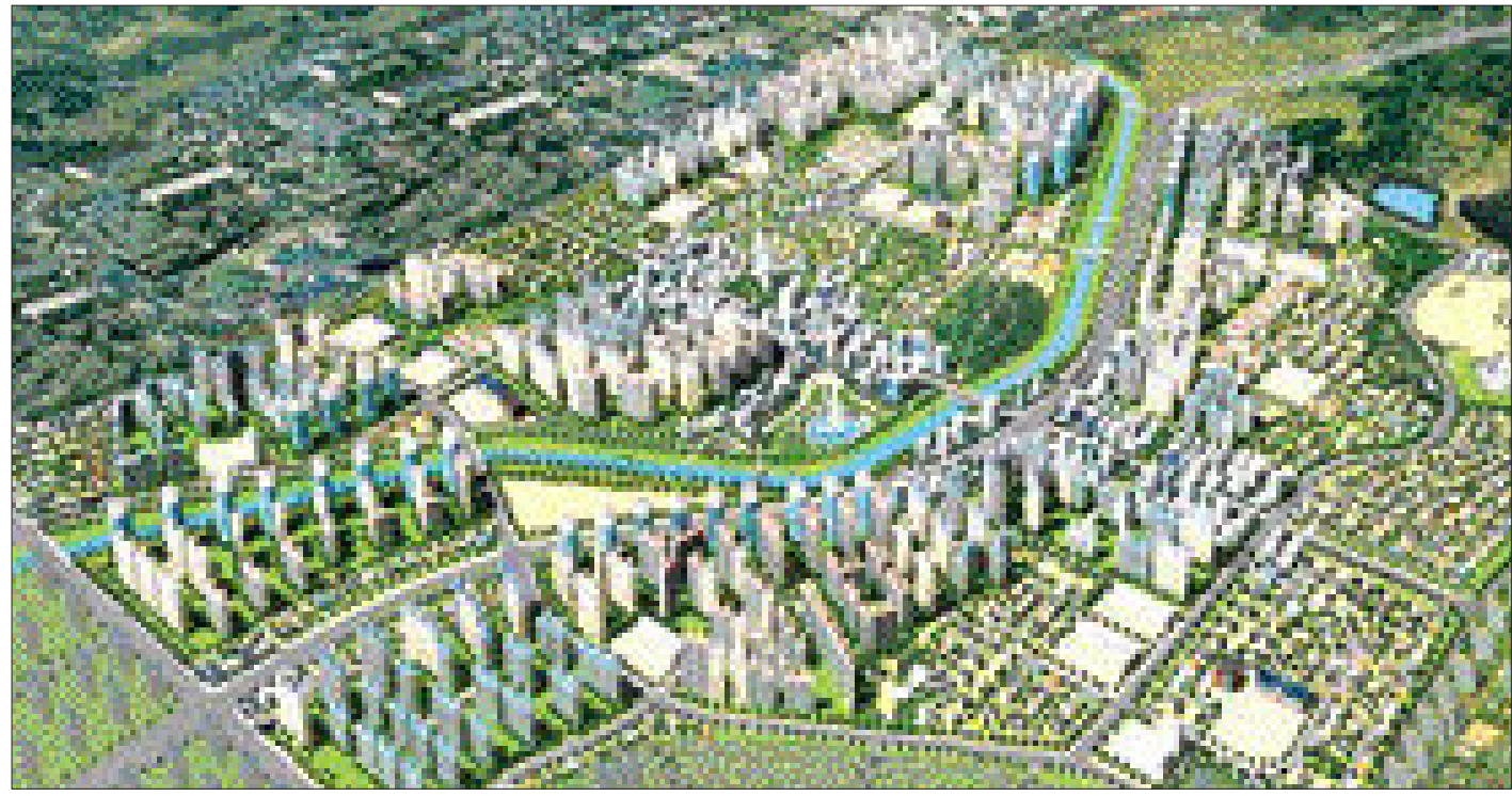
수완지구 11개 건설사 분양 개요 (1차분)

이들 업체는 쾌적한 입지조건과 저렴한 분양가 등을 앞세워 여의도 면적의 1.5배에 달하는 140만평 규모의 수완지구를 환경과 문화, 기술이 조화를 이루는 품격도시로 조성하는데 박차를 가하고 있다.