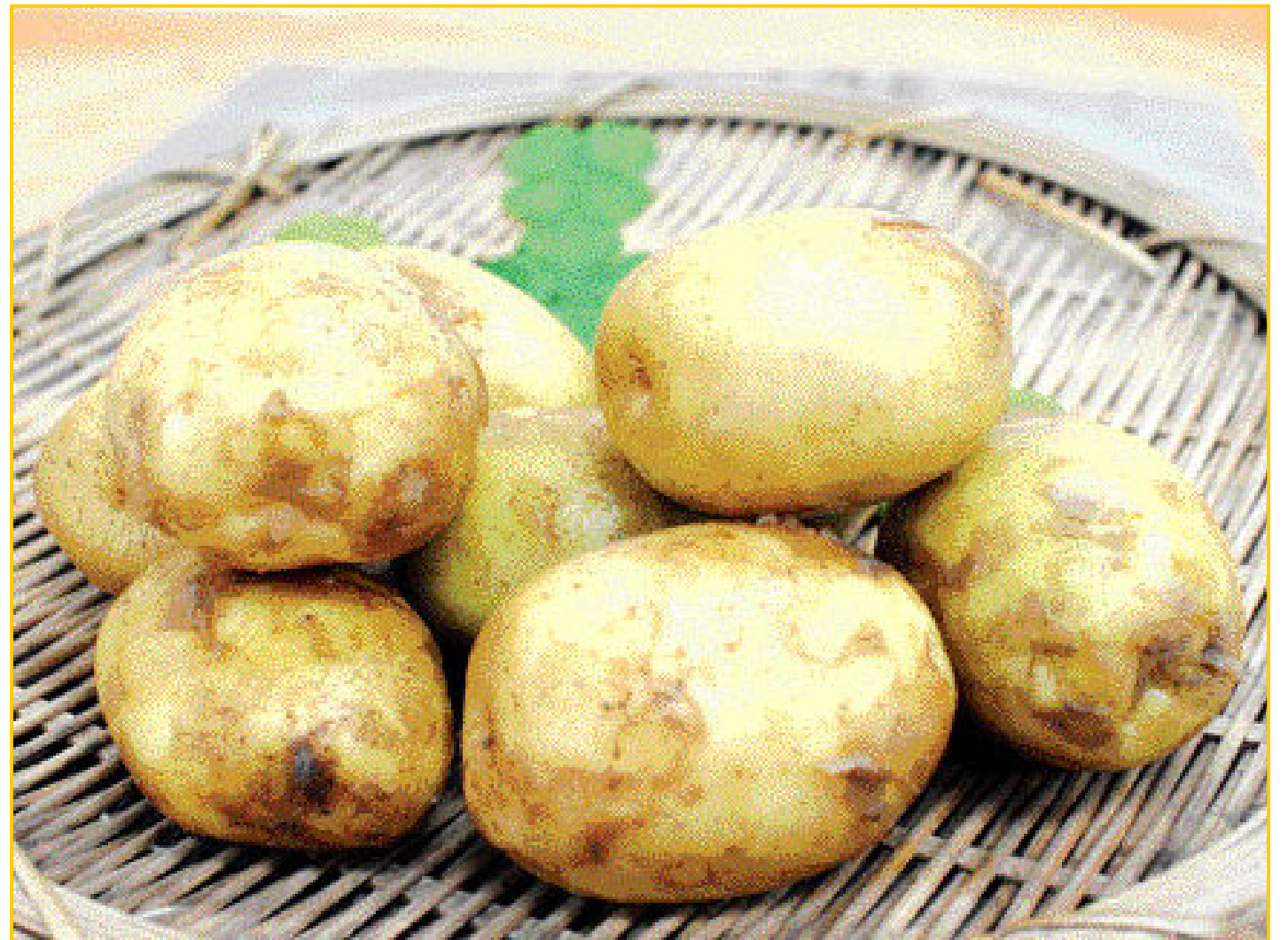
감자는 소화율이 96%로 매우 높고 영양가 또한 높아 건강식으로 사랑받는 대표적인 '뿌리야채'다.

필수 영양소인 비타민C는 사과의 두배에 달한다. 스트레스를 받으면 우리 몸에서는 부신피질 호르몬을 분비해 스트레스로부터 몸을