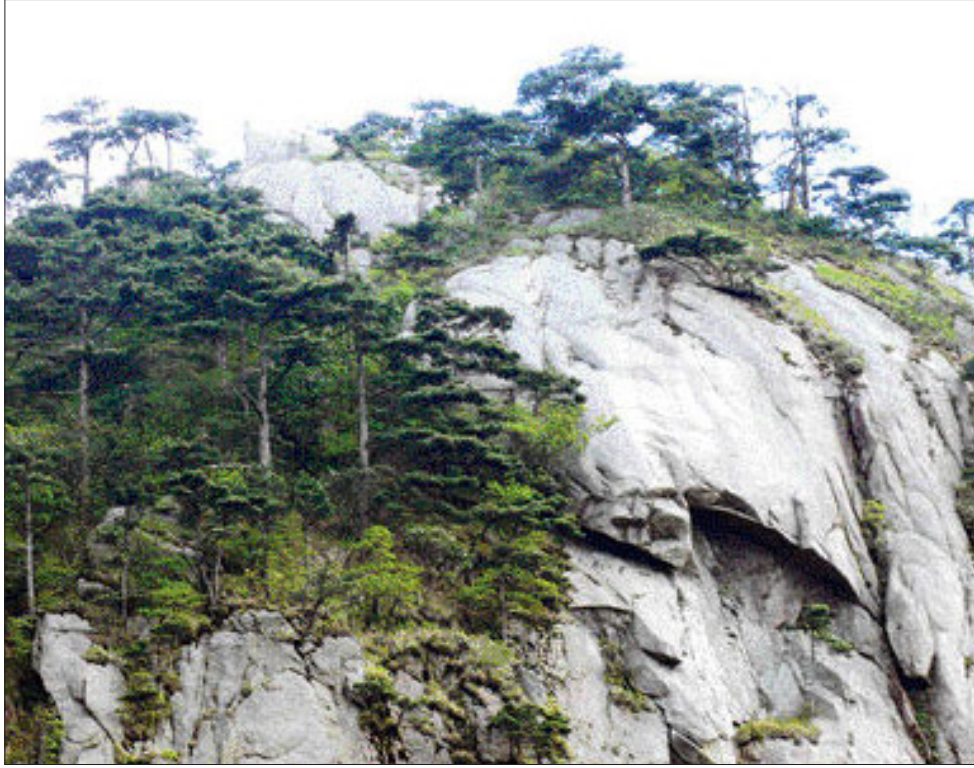
완도 최남단에 위치한 당사도(唐寺島)의 결혈처.