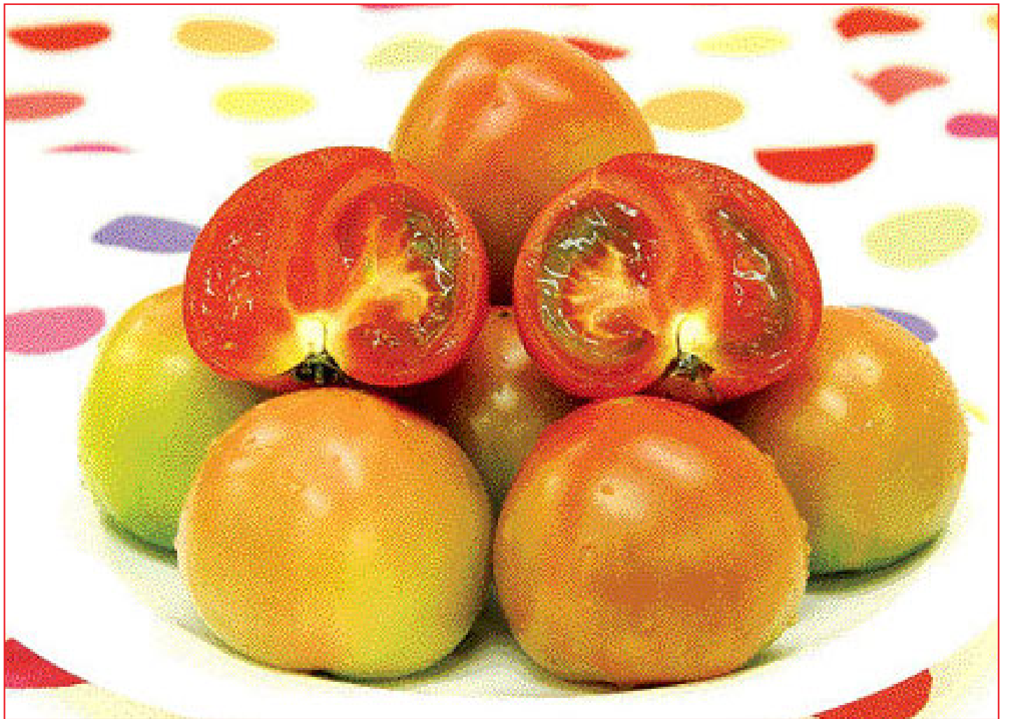
토마토는 항암효과가 뛰어난 리코펜 성분 등을 함유하고 있는 대표적인 건강 과채다.

또 토마토에 들어 있는 셀레늄, 식이섬유소 등과 같은 항암성분은 전립선암 세포의 증식을 억제하는 물질로 꼽힌다.