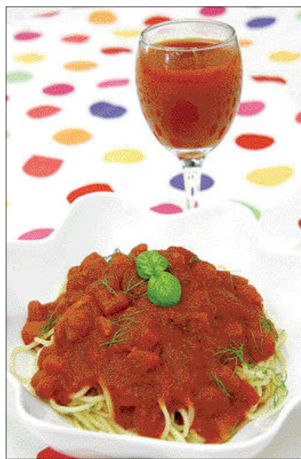
토마토 주스와 스파게티