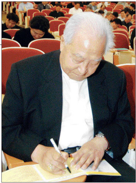
정진석 추기경이 23일 명동성당 문화관 2층 교스트홀에서 열린 '사제성화의 날' 행사에 참석해 보사시 장기기증, 사후 각막 기증 등을 서약한 헌신봉헌서를 작성하고 있다.

정진석 추기경을 비롯한 천주교 서울대교구 사제들이 '사후 장기기증' 서약했다. 정 추기경은 지난 23일 사제들과 함께 명동성당 문화관 2층 교스트홀에서 열린 '사제성화의 날' 행사에 참석해 보사시 장기기증, 사후 각막 기증 등을 서약한 헌신봉헌서를 작성했다.