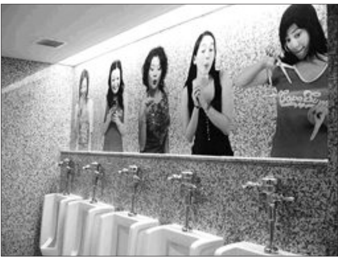
▲업기 화장실 <유니텔 특출>

아내에게 심문을 당했다. "자기 결혼전에 사귀던 여자 있었어? 솔직히 말해봐!" "응 있었어" "자..정말? 사..사랑했어?" "응, 뜨겁게 사랑했지" "뽀뽀도 해줬어?" "해봤지" 얼굴이 노래진 아내가 손톱을 날카롭게 세우고 이빨을 뽀뽀하게 깨고, 몽둥이를 들고서서 말했다. "그 여자 지금도 사랑해?" "그럼, 사랑하지! 첫사랑인데..." 울상이 된 아내가 마지막으로 소리를 뽀 뽀했다. "그럼 그년하고 결혼하지 그랬어!" 가까스로 웃음을 참던 내가 말했다. "그래서 그년하고 결혼 했잖아"