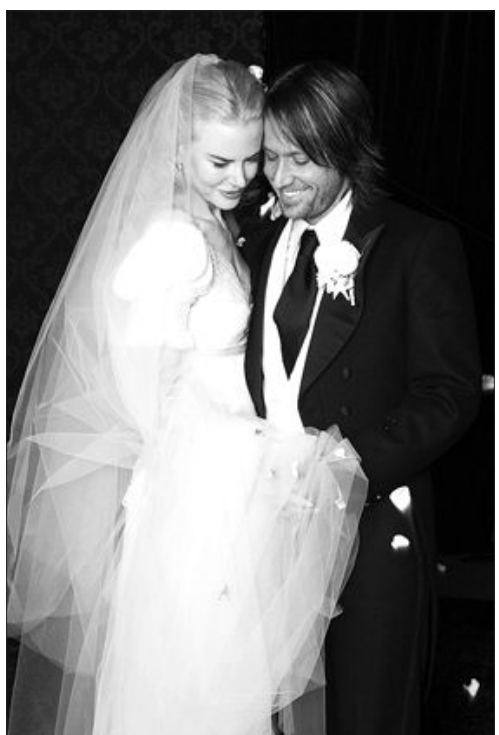
최근 결혼식을 올린 할리우드 배우 니콜 키드먼(39)과 컨트리 가수 키스 어번(38).