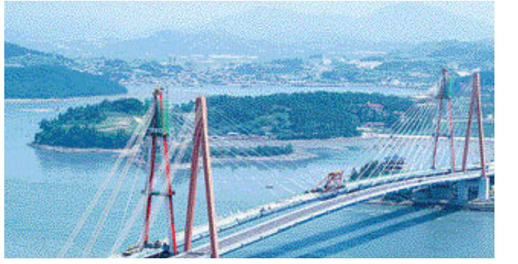
진도대교가 위용을 자랑하는 명량(울돌목) 전경

어명을 받은 이순신은 곧바로 군관 9명과 군사 6명만을 대동하고서 출발하여 8월 8일에 순천에 당도하였다. 순천에서 정예병 60여명을 모아 무장시키고, 14일에 이웃 고을인 보성에 이르러 120명으로 전력을 보강하였다. 그리고 18일에 장흥 회령포(會寧浦, 지금의 장흥군 대덕읍 회진)에 이르러 9척의 전함을 수습하고, 여기에서 선편으로 해남반도를 돌아 29일에 진도의 벽파진에 이르러 전라우수사 김억추(金億秋)에게 명하여 전선을 수습 정비케 하여 3척의 전함을 보내어 도합 12척의 전함을 거느리게 되었다. 여기에 가까운 고을에서 많은 사람들이 100여 척의 피난선을 이끌고 이순신에게 운집하여 전력 보강에 도움을 주었다.