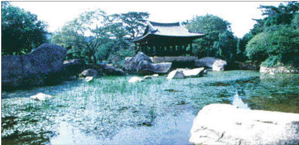
고산 윤선도의 '세연정'

숨어있다. 숙구산에는 늪은 개 한마리가 앞쪽의 '호랑이가 죽어서 바위가 되었다'는 소위 사호암(死虎岩)을 살펴다가 고개를 남쪽으로 돌리고 이내 잠이 들어버린 형국의 면구형(眠狗形)