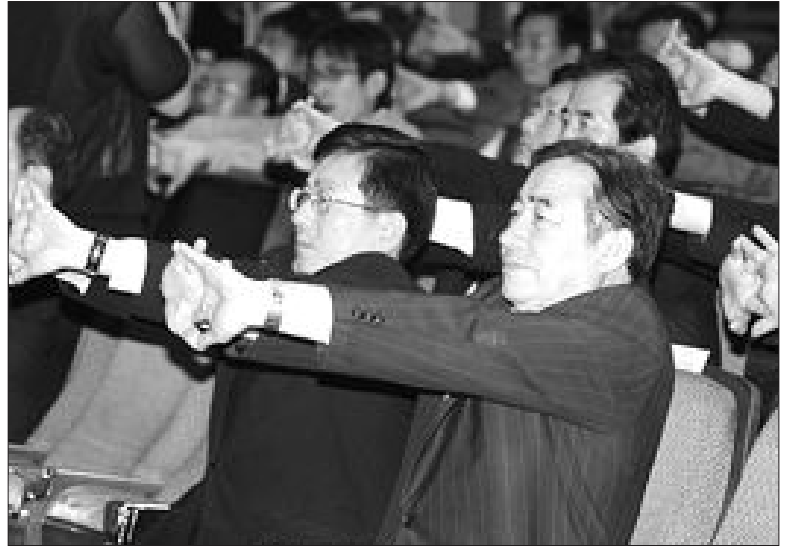
근골격계질환 예방체조 3일 코엑스에서 열린 제39회 산업안전보건대회에서 이삼수(앞줄 오른쪽) 노동부장관과 박길삼 한국산업안전공단 이사장 등 참석자들이 근골격계질환 예방체조를 하고 있다. /연합뉴스

북한은 일본 언론에 메구미씨 유족을 비롯한 일본 일각에서 제기되는 메구미씨 생존설과 유골 진위 논란 등 각종 의혹들에 대해 적극 설명할 것으로 관측된다. /연합뉴스