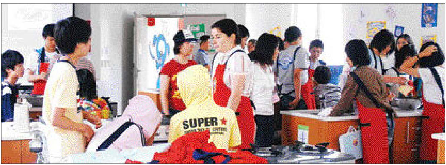
지난달 30일, 5박6일 프로그램에 참가한 경기도 성남시 정자동중학교 2학년 학생들이 치즈 토스트 만들기를 주제로 진행되는 '요리(Cooking)' 수업을 받고 있다.