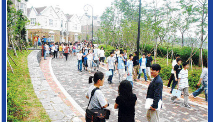
위로부터 파주영어마을 시청과 메인가의 모습. 일일체험 프로그램인 '펀 월드(Fun world)'의 수업 장면. 무료 체험 중 하나인 길거리 공연 모습. 정규과정에 참가한 경기도 내 중학생들이 기숙사를 나서는 모습.