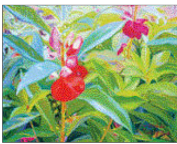
'울밑에 선 봉선화'