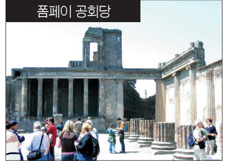
중양역과 중앙 버스터미널은 도시의 옛 심장부 바로 가까이에 있다. 나폴리만 남쪽과 서쪽에는 산타루치아와 메르켈리나가 있는데 둘다 그림같이 아름다운 풍경으로 인해 역사 유적 중심지와는 다른 느낌으로 다가온다.

▲ 폼페이 -AD79년 베수비오 산이 폭발하면서 폼페이는 한순간에 화산력층 아래에 묻혔고, 2천여명의 목숨을 앗아갔다. 세계에서 가장 유명한 이 화산 대재앙은 고대 로마인의 일상생활을 생생히 보여주는 귀중한 유적으로 남아있다.