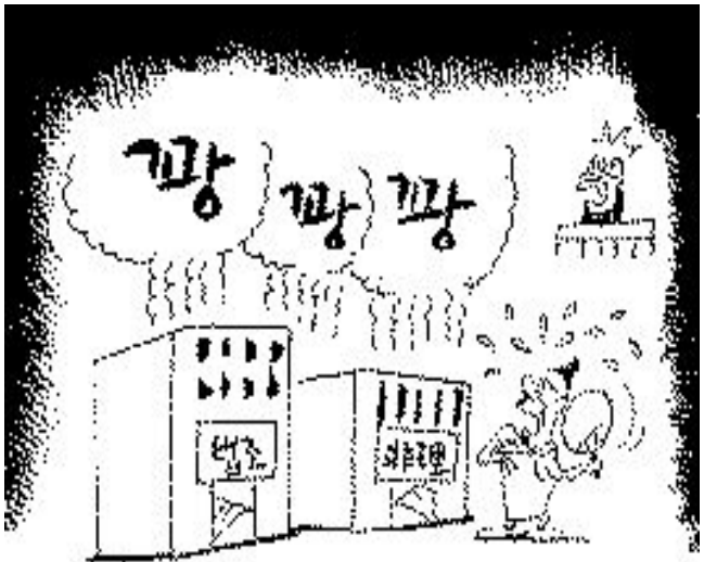
국민들 열받게 하는데는 일가견이~