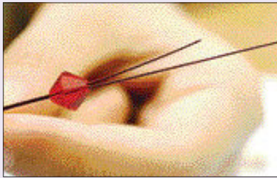
통과기법-같은 방향으로 뉘시줄을 통과하는 것을 말한다. 일명 ‘끼우기’ 기법이다.