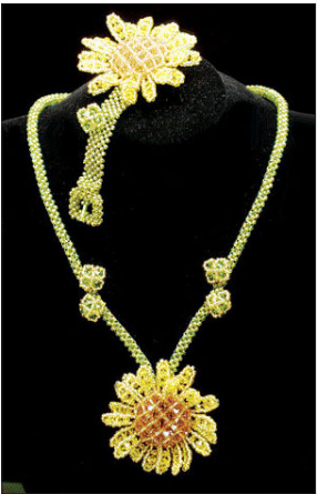
●이오 클래식 비즈 마감재료까지 모두 비즈로 금속알레르기 피할 수 있어