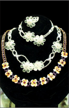
●크리스탈 비즈 원석이나 크리스탈을 이용 만들기 쉬워 초보자에 인기