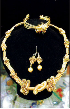
●와이어 비즈 와이어(철사) 공예를 접목 화려하고 독특한 느낌 연출