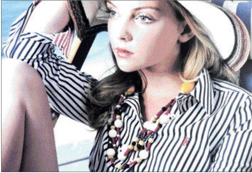
평범한 셔츠에 엔티크한 비즈 액세서리를 해주는 것만으로도 한층 돋보일 수 있다. 비즈공예는 목걸이·귀고리·팔찌 등 다양한 제품을 만들 수 있다.