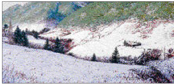
류재웅 작 '아름디는 시절'