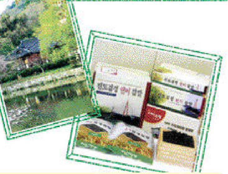
광주·전남 지역 팜스테이 마을