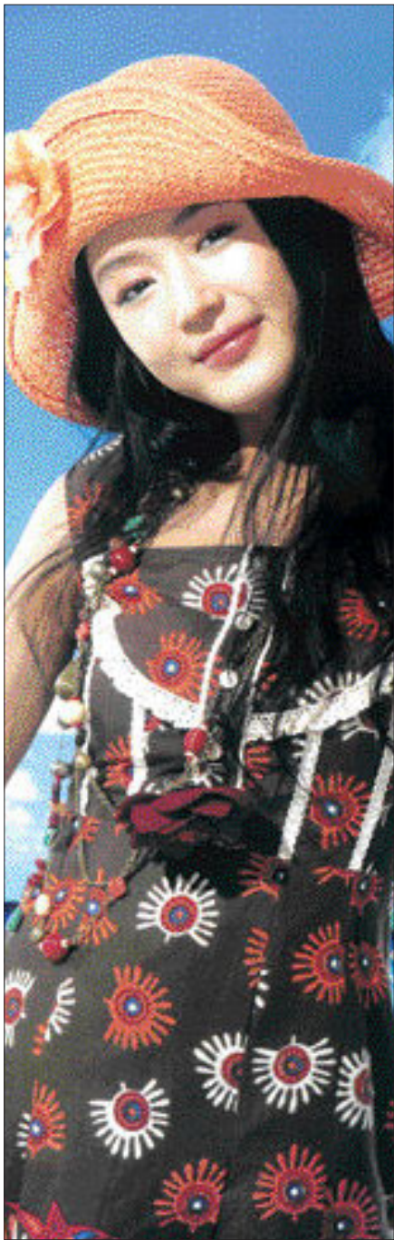
화사한 원피스에 챙이 넓은 모자를 이용해 잡지 화보에 나오는 모델처럼 꾸며보자.