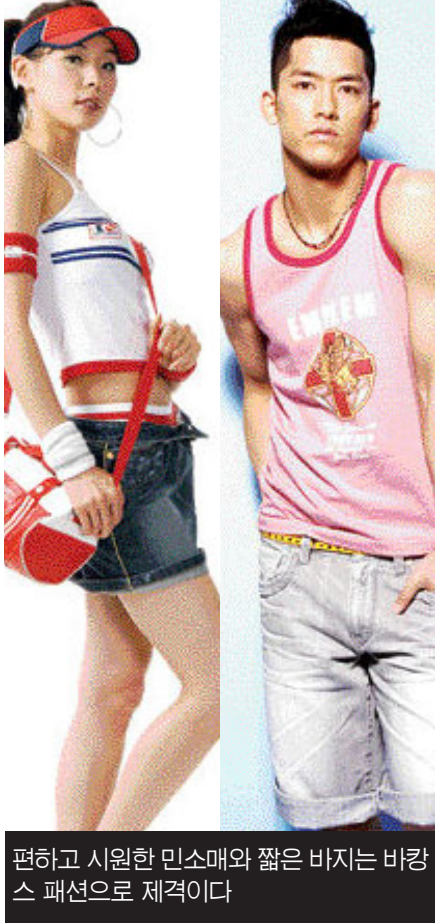
편하고 시원한 민소매와 짧은 비지는 바캉스 패션으로 제격이다

감쪽한 그림이 그려진 흡 웨어용 원피스는 간편해서 좋다. 레이스나 리본이 달린 제품 등 외출복과 흡사한 제품도 많이 출시되고 있는 만큼 가까운 슈퍼 정도는 원피스만 입고 외출이 가능하다. /객선정기자 ksj@kwangju.co.kr