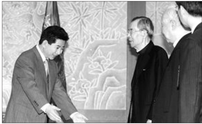
노무현 대통령이 24일 발터 카스퍼 추기경과 함께 청와대를 방문한 김수환, 정진석 추기경에게 자리를 권하고 있다.

에서 제기되고 있는 광주지방 경찰청 신설 무산 설은 사실이 아니다”라며 “조만간 광주 경찰청 신설을 위한 조직 구성안 등을 확정하고 이에 대한 예산안을 기획예산처에 제출할 예정”이라고 밝혔다. 또한 장병완 기획예산처 장관도 이날 “행정자치부에서 예산안 및 조직안 등을 제출하면 곧바로 예산에 포함 시키겠다”는 입장을 나타냈다고 양형일 의원이 전했다. 이에 따라 행자부에서 이달 말까지 조직안과 예산안을 기획예산처에 올리는 대로 정부 예산에 포함, 9월 예