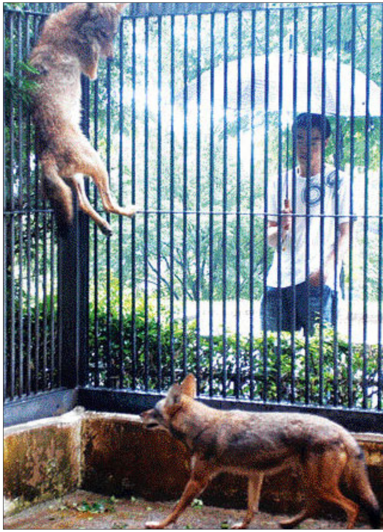
우치동물원 새 식구 코요테 25일 오후 광주 우치동물원에서 코요테 암수 한 쌍이 즐거워 한 때를 보내고 있다. 이들은 최근 서울대공원에서 들어왔다.