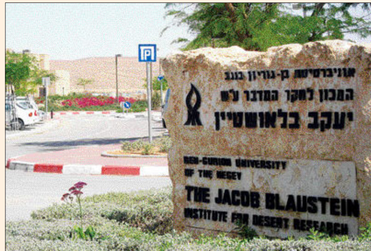
벤 구리온 사막연구소 입구. 이 연구소는 이스라엘의 사막 방지화를 막고자 했던 ‘제이콥 블라우스틴’의 후원으로 세워졌다.