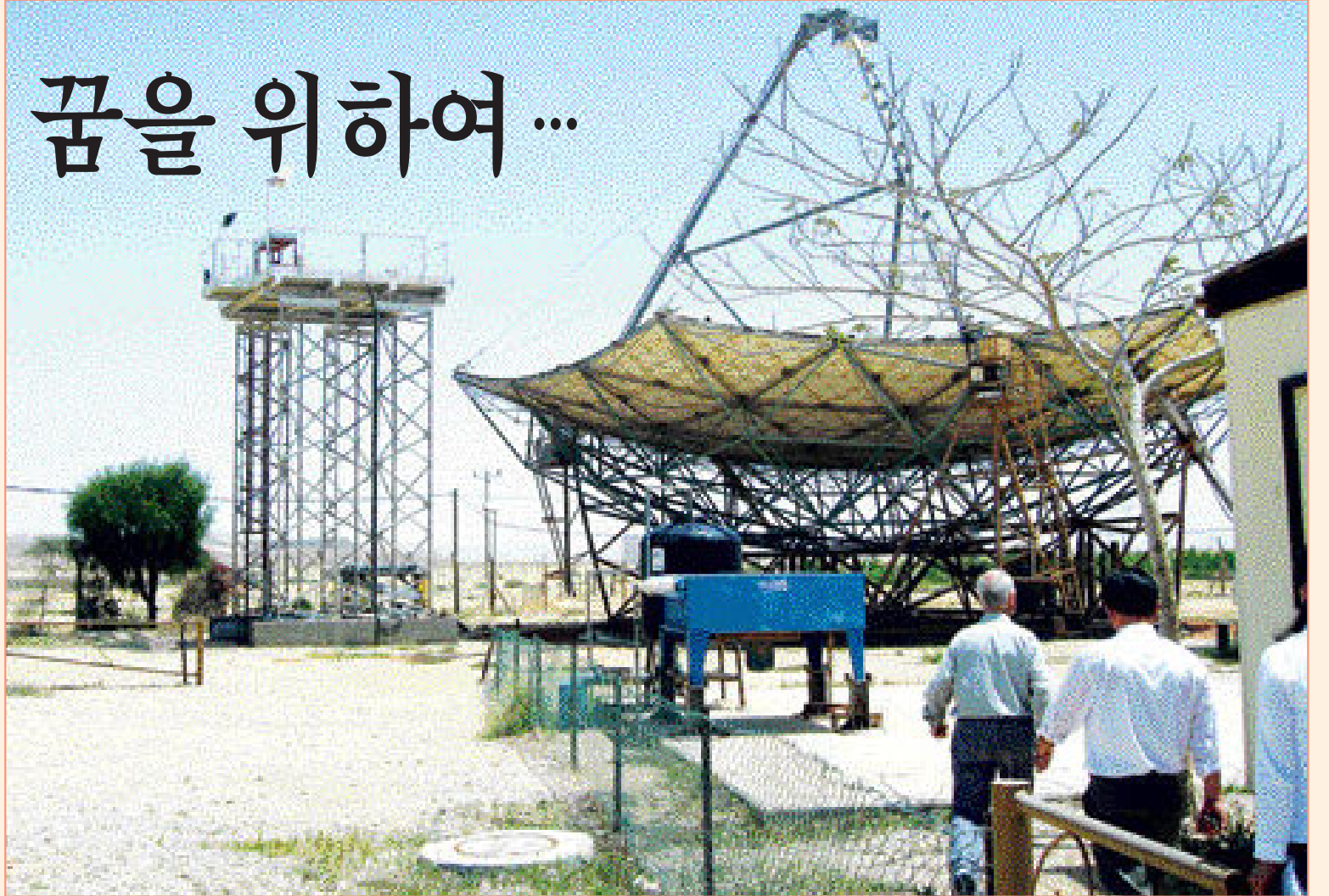
벤 구리온 연구소가 자랑하는 ‘태양광 집열판’은 점시형으로는 세계 최대 규모로 400kw의 전력을 생산한다. 이는 대략 정상적인 태양에너지의 1만배 규모다.

생활 시간이 없는 것에서부터 ‘지구 황폐화’ ‘사막화’가 시작한다는 분석이었다. 벤 구리온 사막 연구소에서는 ‘오직 교육’이라는 철학을 고수하고 있다. 전세계에서 온 200여명의 학생 (한국인은 없다) 대부분은 석·박사과정으로 수업은 100% 영어로 진행된다. 이중 40%가 콩고, 탄자니아, 잠비아, 콜롬비아, 중국 등에서 온 외국인. 자르미 교수는 “선진국 출신 학생이 적은 이유는 그들 나라에서는 사막이 현안이 아니기 때문”이라며 “이스라엘의 정치적 상황만 좋았어도 유학생이 더 많았을 것”이라고 말했다. 이수학점은 석사의 경우 총 32학