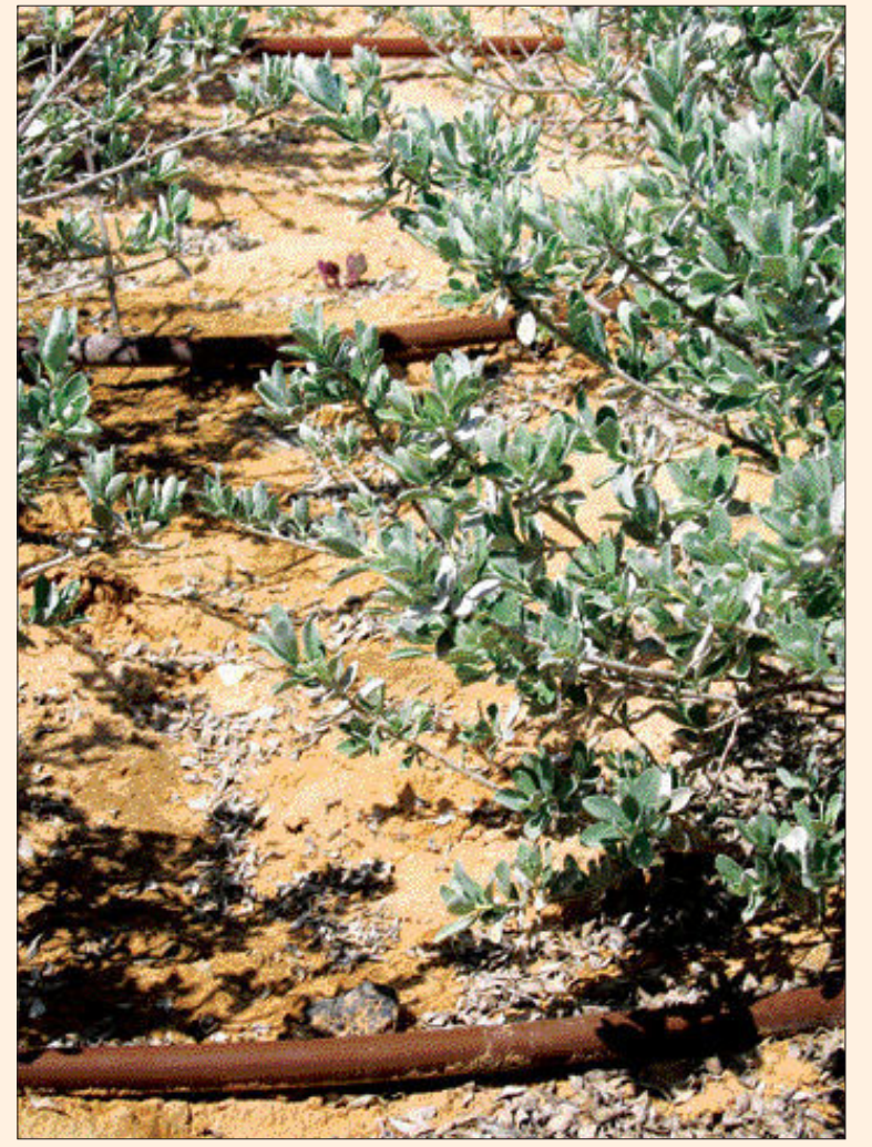
이스라엘은 ‘내셔널 워터캐리어’(National Water Carrier) 시스템으로 수원을 관리한다. 사막 한 가운데에서도 꽃을 피울 수 있는 비결이다. 일정한 간격으로 배치된 호스에서 일정한 시간에 물이 나와 화초에 물을 공급한다.

벤 구리온 사막연구소는 이스라엘의 거대한 사막지역에 공급되는 양질의 태양에너지를 ‘태양 집중 장치’에 모이게 해 전력을 생산하게 하는 연구에 몰입하고 있다. 피할 수 없는 환경, ‘사막’의 높은 태양열을 ‘산업화’하기 위한 것이다. 자르미 교수는 “네게브 사막의 적은 강수량은 태양 에너지 발전 시설을 건립하기에 좋은 조건”이라며 “태양열 발전은 발전단가가 비싸지만 충분한 경제성을 갖추고 있어 미래 유력한 에너지원으로 부상할 것이라는 판단 하에 많은 투자를 하고 있다”고 말했다. <끝>