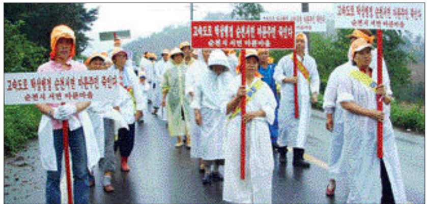
순천시 서면 구상리 마륵마을 주민 40여명은 26일 집단이주를 요구하는 시위를 벌였다.