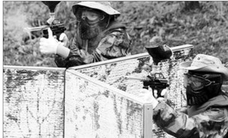
청소년 '독립군 전투 체험' 27일 충남 천안시 국립중앙청소년수련원에서 열린 독립군 체험행사에 참가한 청소년들이 청산리전투를 재현한 서바이벌 게임을 진행하고 있다.

냈던 소득수지가 3월 결산방식의 대외매담금 지급 증가 등으로 월중 적자로 전환되면서 흑자 규모가 전월보다 2억6천만 달러 줄어든 11억 달러 흑자로 나타났다. 월간 경상수지는 올해 1월 9천만 달러 흑자 이후 2월 7억6천만 달러 적자, 3월 4억3천만 달러 적자, 4월 16억 1천만 달러 적자 등으로 석달 연속 적자 행진을 이어왔으나 5월에 12억 7천만 달러 흑자로 전환한 이후 6월에 11억 달러 흑자를 내 경상수지가 흑자도 적자도 아닌 상황에 이를 것이라고 전망했다. 6월 경상수지는 5월에 흑자를 나타