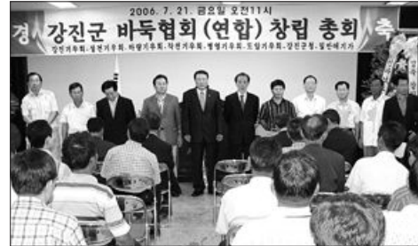
49기 국수전 도전 제2국 개최를 계기로 출범하게 됐다. 지역 바둑인들은 이 대회 유치를 발판으로 '영원한 국수' 김인 9단의 고향인 강진 바둑을 활성화하려는 데 뜻을 같이했다.

선진·마라·방영·작천면 등 강진군 8개 기우회를 주축으로 출범한 강진 바둑협회는 국내 주요기전 강진 유치, 동호인 대항전 개최 등 바둑 보급사업을 펼칠 예정이다. 군 바둑협회는 지난 2년 대구면에서 열린 제