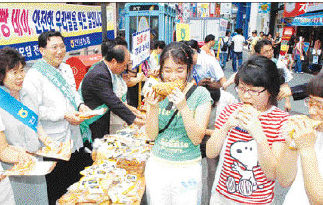
매월 1일은 우리쌀 빵데이

작년동기대비 내수 12.8·수출 36.2% 급감 현대차도 내수 점유율 37.2%... 8년래 최저 5천687대로 작년 76만2천339대보다 3.1% 늘었다. 모델별로는 오피러스가 내수에서만 3천1대가 팔려 대형차 시장에서 지난달에 이어 판매 1위를 지켰고 로체(2천886대), 카렌스(2천556대), 뉴스포티지(2천386대) 등이 뒤를 이었다. 한편 현대자동차도 지난달 노조파업으로 내수점유율이 8년만에 최저치를 기록하는 등 판매량이 급감했다. 현대차는 지난달 판매대수가 12만8천489대로 전월대비 43.7%, 작년 동기 대비 36.7% 각각 감소했다고 밝혔다. 내수는 2만8천97대에 그쳐 작년 동기 대비 46.4% 줄었고, 수출도 10만392대로 33.4% 감소했다. 이에 따라 현대차의 내수