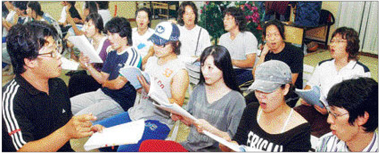
남성 처음 뮤지컬에 도전하는 '얼쑤'와 '진달래 피네' 단원들이 노래연습을 하고 있다.