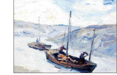
구상화를 추구한 오지호 화백의 '해경'