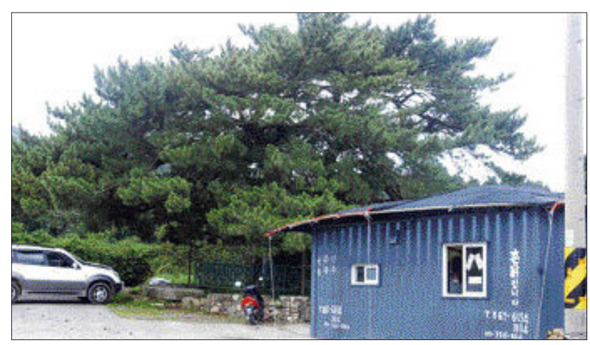
펼쳐진 컨테이너... 천연기념물 제356호로 지정돼 보호를 받고 있는 장흥군 관산을 옥달리 당동마을 효자송(孝子松)밑에 컨테이너 박스를 개조한 음식점이 들어서 관광객들의 눈길을 쫓아주려 하고 있다.

한편, 전남도내 순천 등 동부권을 중심으로 콜센터 구축·운영을 위한 대형보험사 등의 투자상담이 잇따르고 있어 금강대 대규모 사업체 유치가 가시화될 전망이다. /순천=김진수기자 jsk2229@