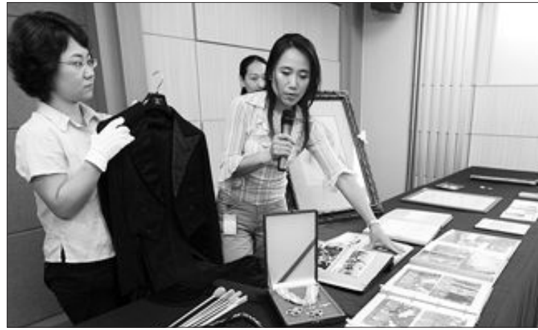
안익태선생 유품 공개 국립중앙박물관이 안익태기념재단(이사장 김형진)으로부터 기증받은 선생의 유품을 3일 공개하고 있다. 기증된 유품은 안익태 선생이 임했던 연주복(왼쪽)과 지휘봉, 스승인 리하르트 스트라우스와 함께한 사진 등 550점이다.

또 전월 2자구의 40평형 B아파트를 분양받았다면 기존 거래세는 1천560만원이지만 앞으로는 528만원으로 줄어든다. /임동욱기자 tuim@kwangju.co.kr