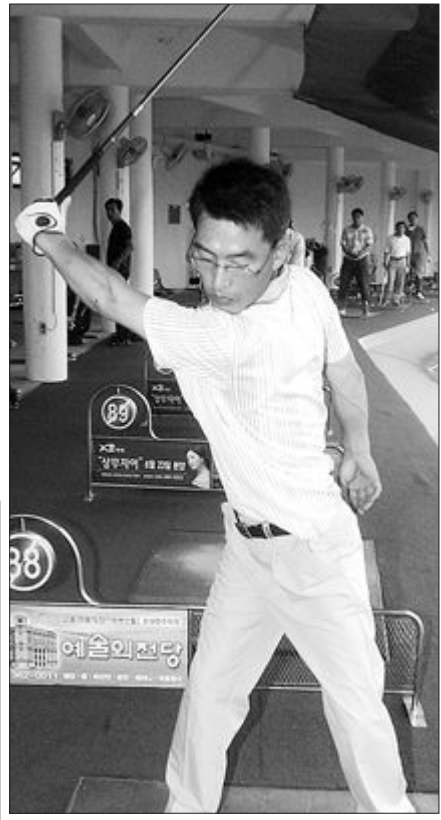
▲어깨 턴을 익히기 위한 왼손만으로 스윙연습.