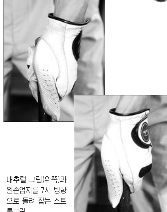
내추럴 그림(위쪽)과 왼손엄지를 7시 방향으로 돌려 잡는 스트롱그립.